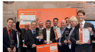
Alle Sieger des INNOVATIONSPREIS-IT 2013 auf der CeBIT